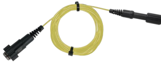
* (Imagen referencial)