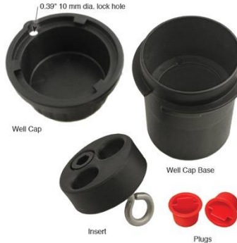
* (Imagen referencial)